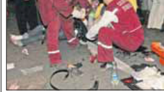
Erste Hilfe am Tatort: Sanitäter kümmern sich um Verletzte des Anschlags im Zentrum von Minsk.