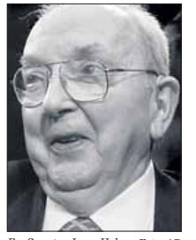
Er-Senator Jesse Helms